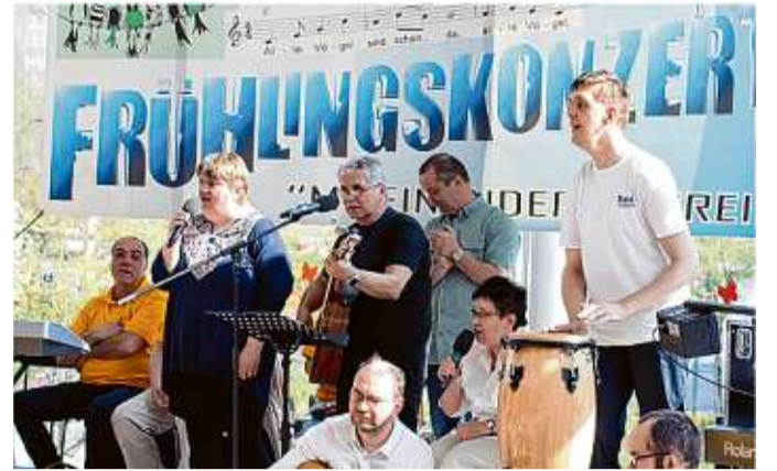
Die Lebenshilfe lädt am kommenden Sonnabend zum Frühlingskonzert ein.

Es treten auf: Ingrid Berhold mit Schülerder Musikschule, Kinder der Integrationskita der Lebenshilfe „Kita Finkenhäuschen“ und „Kinderhaus am Südring“ sowie Kinder und Mütter aus dem Projekt der Lebenshilfe „Ukraine-Hilfe“. Des Weiteren sind auf der Bühne „Raouls Freunde“ und die Gruppe „Take All“ zu erleben.